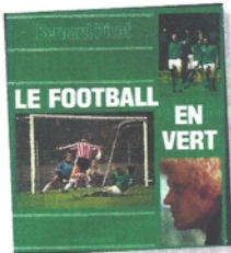
Bernard Pivot, Le football en vert , éd. Hachette / Gemma, 1980.

La plus belle épopée du club de 1974 à 1977 entraîne la sortie de nombreux opus. L'Histoire s'écrit au quotidien, les Verts entrent dans le paysage littéraire français. A ceux édités par le club, s'ajoutent huit livres pour la seule année 1976.